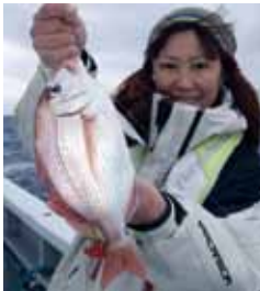
▲ハナダイは30センチ級も交じった