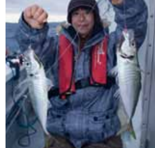
▲フラッシャーサビキでは40センチ近い大アジも掛かってきた