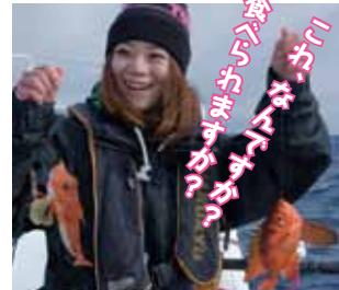
▲キントキはめずらしいゲスト