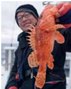
▲アマダイポイントでオニカサゴも狙える