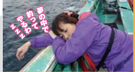
▲ついにダウンしちゃいました

ここでは逆に潮は動かないものの、釣りやすい状況。ホウボウやメバルに交じって中小型のマダイがポツポツと掛かってくる。同船の1さんは大型のバラシを含め、1キロ弱を2枚の釣果。それでも船長は前日吹き荒れた南西風のせいでは食いは今一つだと言う。