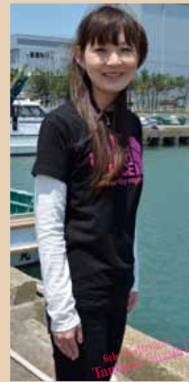
家族全員が釣り大好きで、応募したのは父親です。普段は手賀沼、銚子のほうの陸っぱりが多いのですが、昨年初めて船釣りを体験して好きになりました。