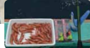
▲速潮に備えてテンヤは10号以上も忘れずに