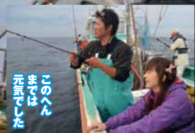
このへんまでは元気でました ▲初心者には若船長がていねいに教えてくれる