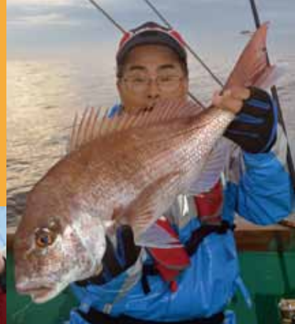
▲この日最大は2.6キロ